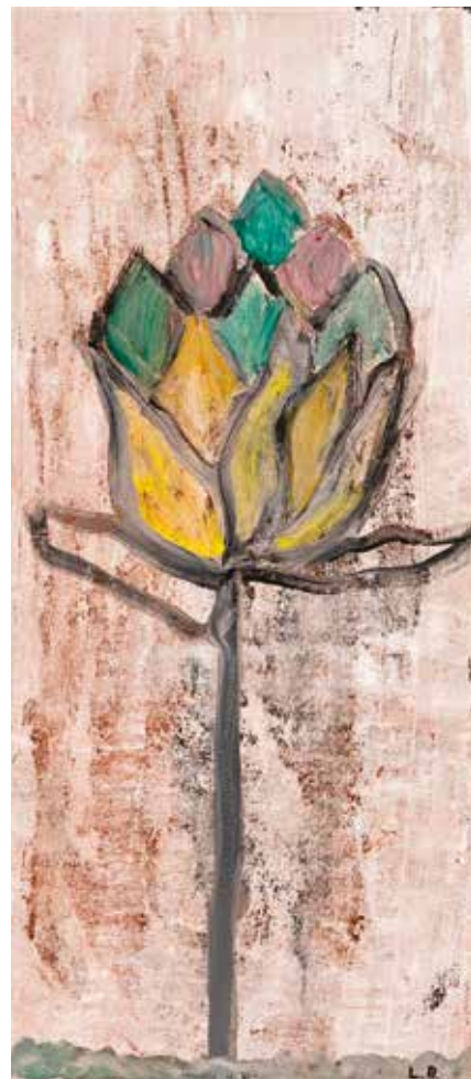
Leonie Barišić , Der Weg zum Herzen kombinirana, 25 x 60 cm