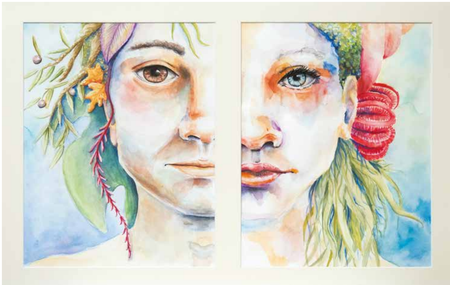
Lucija Ukić , Budi moje kopno, ja bit ću tvoje more akvarel, 53,5 x 57 cm