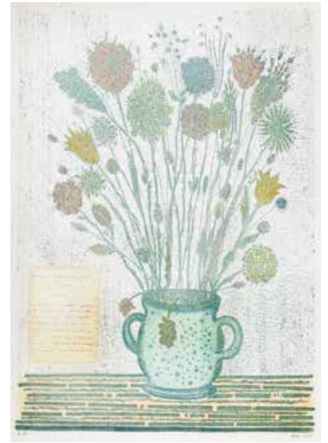
Wolfgang Baur , Fiori storici litografija, 68 x 87 cm