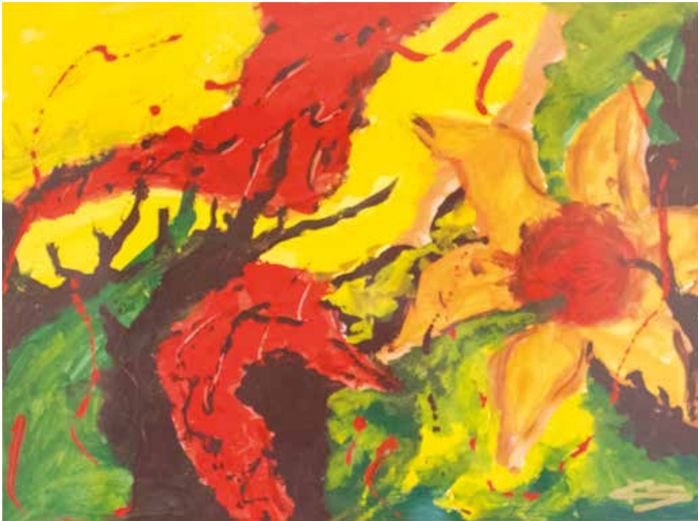
Chris Koulen , Bulmeurt, Flora und Hyos tempera, 40 x 30 cm