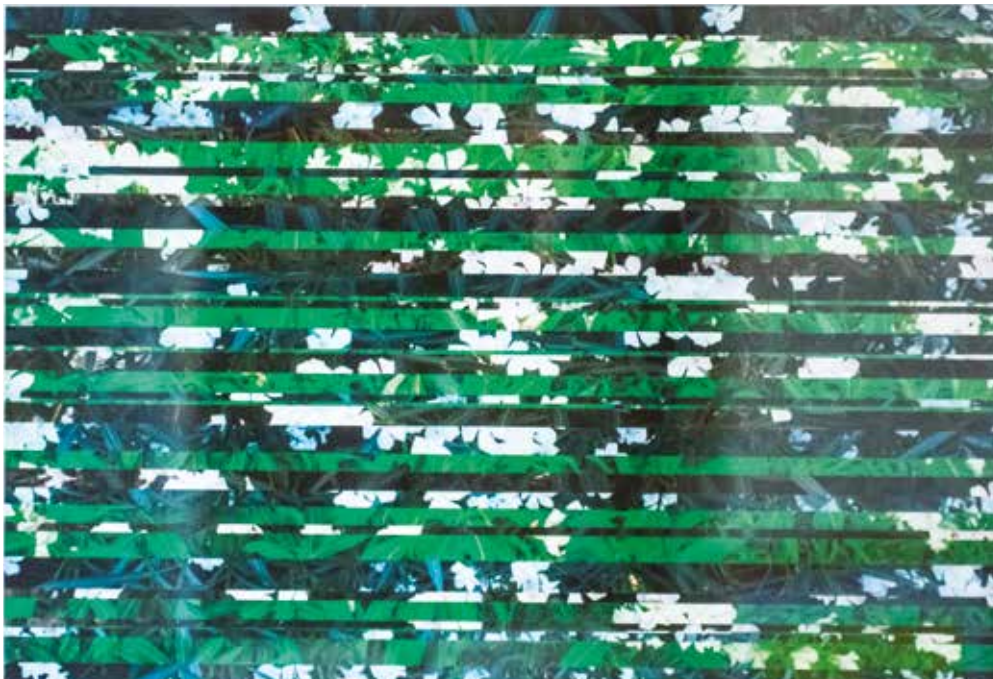
Vjekoslava Sošić , Simbolika i ljepota cvijeća raster fotografija, 40 x 70 cm