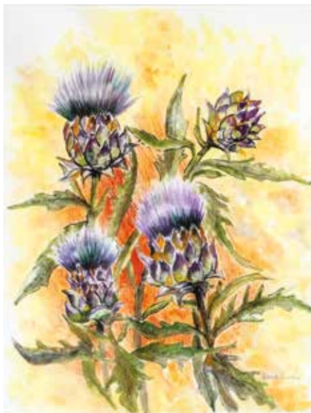
Divna Kontošić , artičoki u cvatu akvarel, 55 x 75 cm