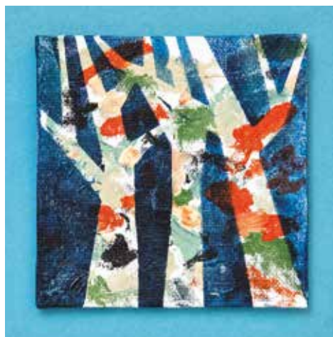
Radoslav Putnik , Boje noći akril, 22 x 22 cm