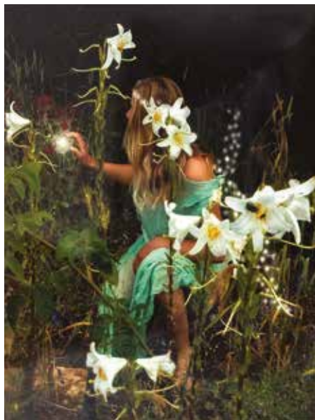
Igor Drandić , Connection fotografija, 30 x 40 cm