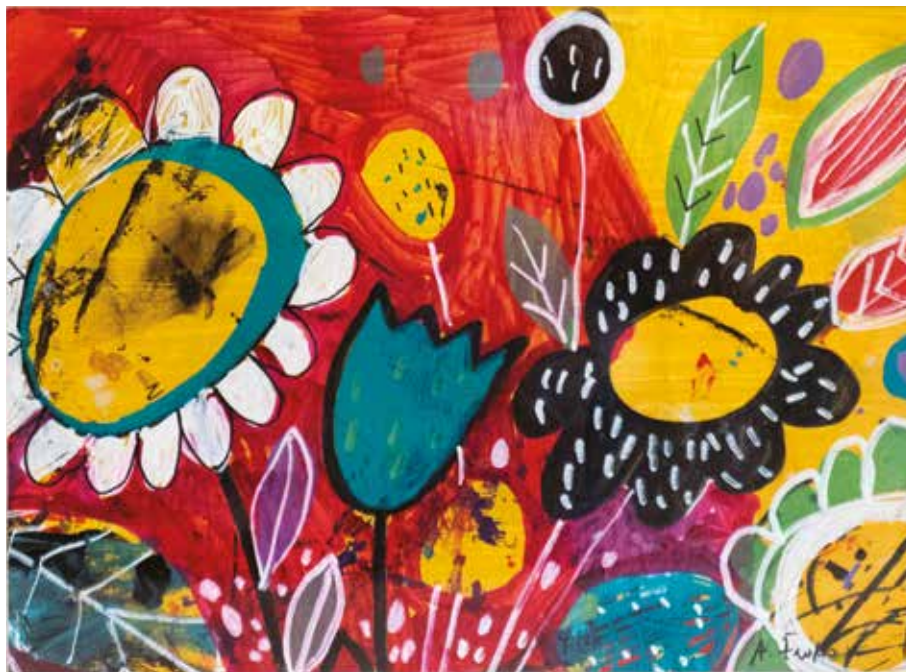
Andreja Živko , Volim cvijeće akril, 40 x 30 cm

L'artista e architetta slovena Leonida Goropevšek manifesta una configurazione archetipica della magica forza dei fiori, mediante la tecnica grafica della calcografia - reserveage (franc. „ Gravura au sucre “). Con questa tecnica presenta alla perfezione il legame lirico, delicato del magico mondo intermedio delle piante e dell'uo-