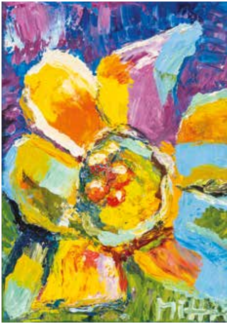
Mihaela Zaharija , Cvjetni mix ulje na platnu, 40 x 30 cm