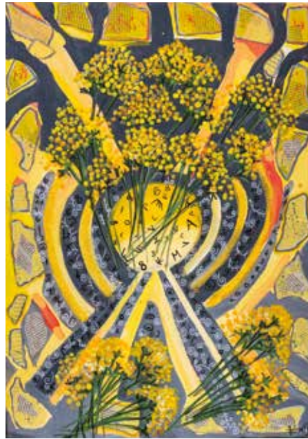
Helena Testen , Info Immortelle mješovita, 50 x 70 cm