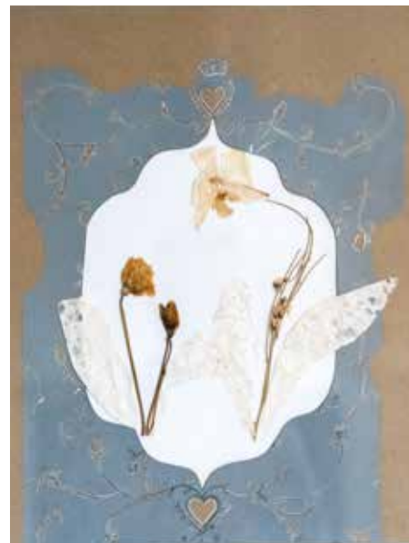
Danijela Simović , Orhideja-dekadencije kolaž, 30 x 30 cm