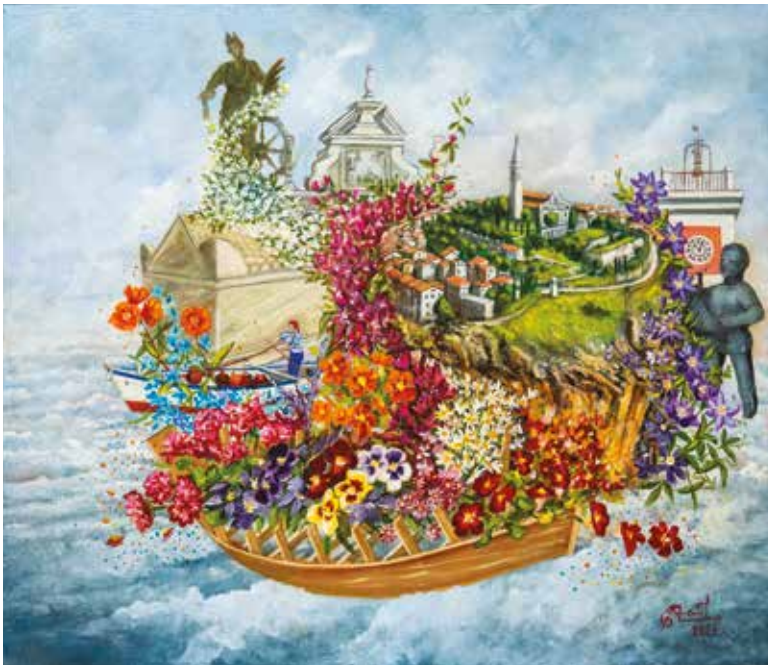
Duilio Trošt , Kartulina iz Rovinja ulje na platnu, 70 x 60 cm