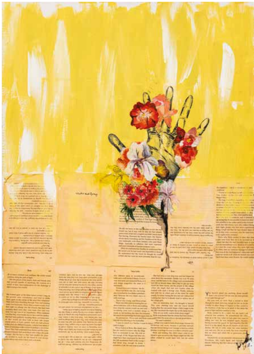
Klaudija Jurić , Hand and flowers mješovita, 50 x 70 cm

Pristigao nam je niz odličnih radova u tehnici keramike, instalacije, mozaika, tehnike fuzije stakla, kolaža, fotografija, slika nastalih klasičnim slikarskim tehnikama. Zbog skučenosti prostora galerije, selekcija je bila nužna, ali ako netko nije izabran - neka mu to bude poticaj za dalji rad.