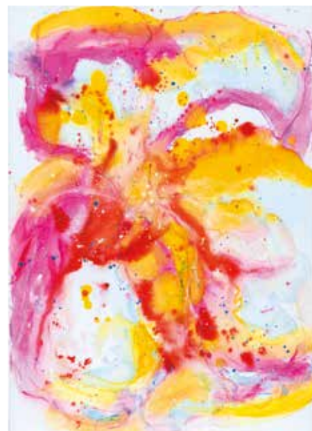
Darija Stipanić , Fragile beauty akril, 50 x 70 cm